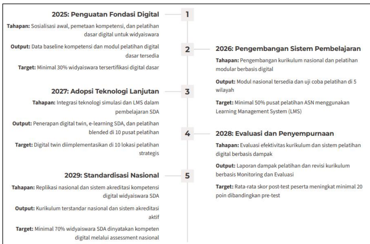
Gambar 3. Roadmap Transformasi Kompetensi Widyaiswara SDA Digital